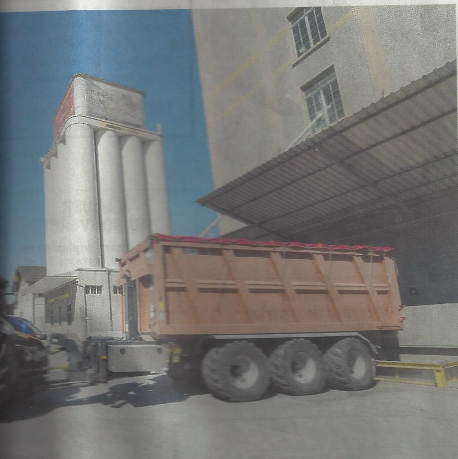
à Sion son premier chargement de seigle, soit 20 tonnes de céréales. SACHA BITTEL